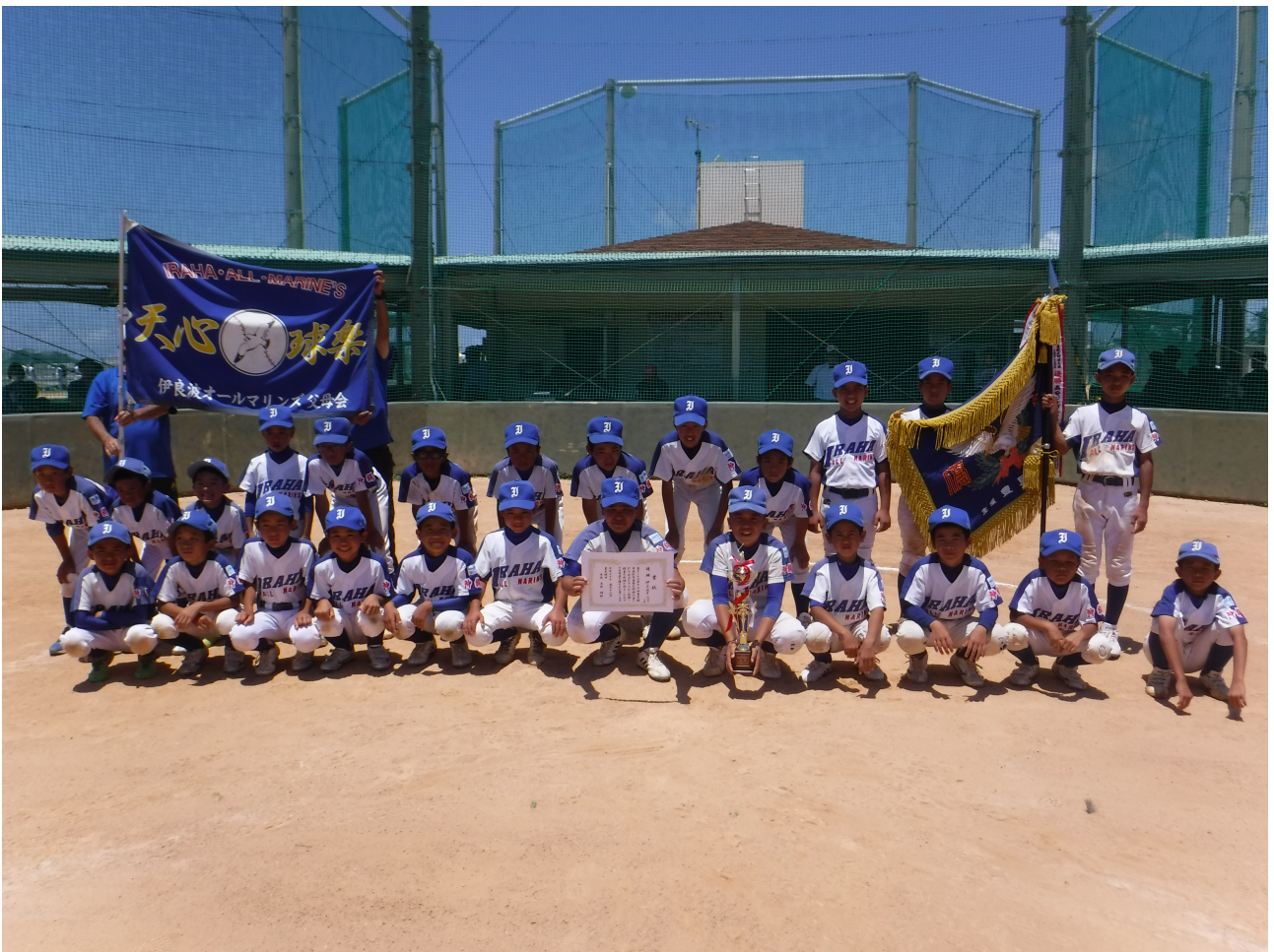
<写真>前大会優勝チーム:伊良波オールマリンス